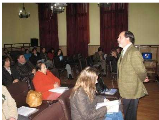
Director del Servicio de Salud Coquimbo en charla de apertura

Otro de los conceptos fundamentales de este seminario fue la aplicación del concepto de seguridad en los procesos como dimensión relevante de la gestión de calidad, lo que implica la adopción de medidas de seguridad para el paciente y los proveedores de servicios.